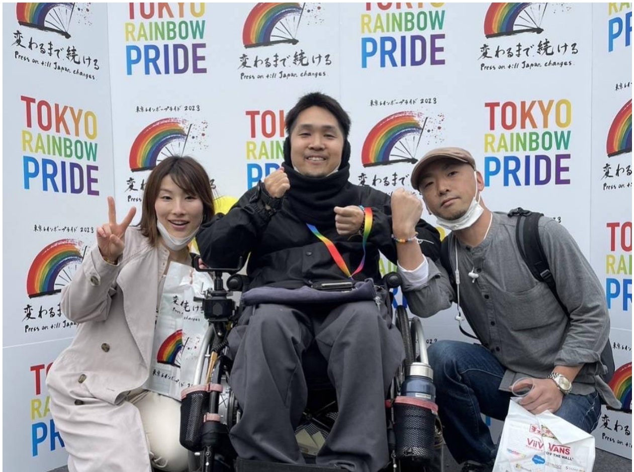
東京レインボープライド 2023 プライドフェスティバルより