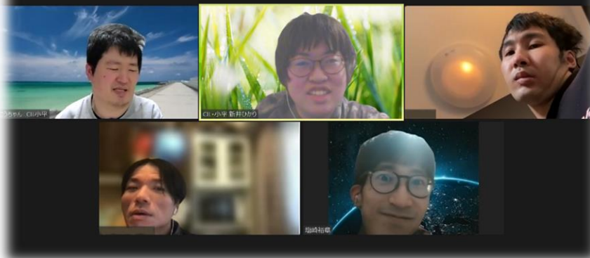
ちょうきあいえるぴー 長期 I L P の しゅうごうしゃしん 集合写真

はや なつ もど ねが きょう ごろ 早くその懐かしさが戻ってきてほしいと願っている今日この頃です。