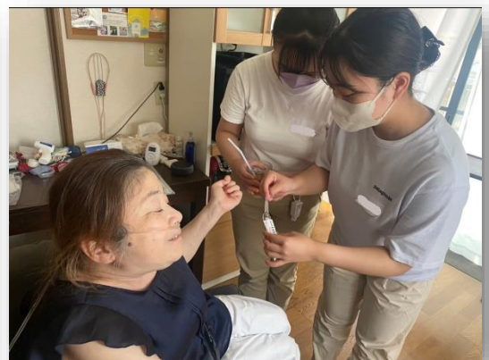
とうきょうかいさい じっしゅうたいけん ようす 東京開催の実習体験の様子