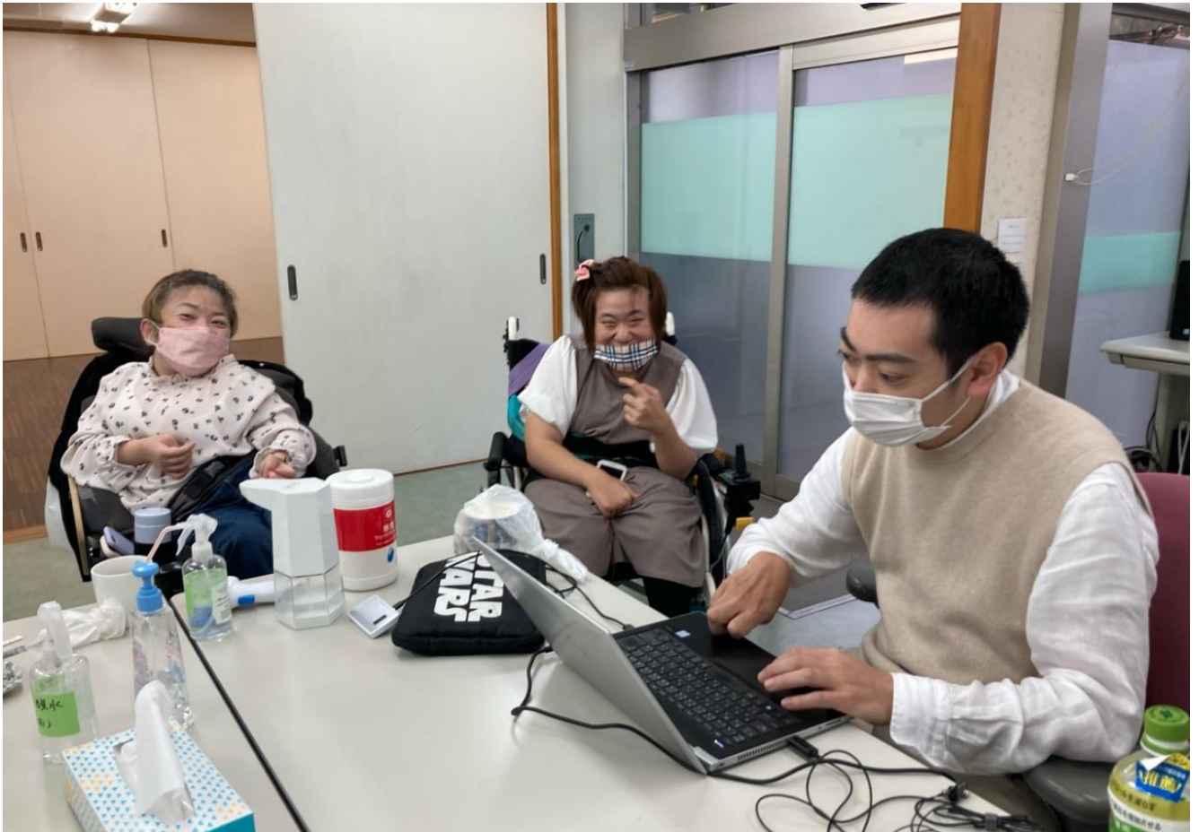
じむしょ しごとふうけい 事務所での仕事風景